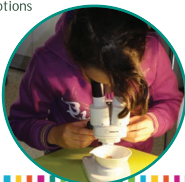
Observation d'un cricket à la loupe binoculaire

Les enfants disposent d'une bibliothèque virtuelle d'éléments pour créer un animal imaginaire. Ils sélectionnent les différentes parties qui formeront le corps et choisissent les caractéristiques physiques de cet être vivant en fonction du milieu dans lequel il vit.