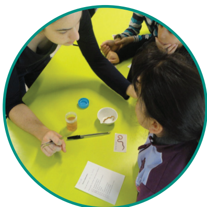
Comment est constitué un vers ?